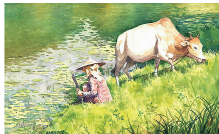
水彩画 15,000円/額装 25,000円(送料込み)